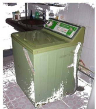
80年代以前的“四大件”