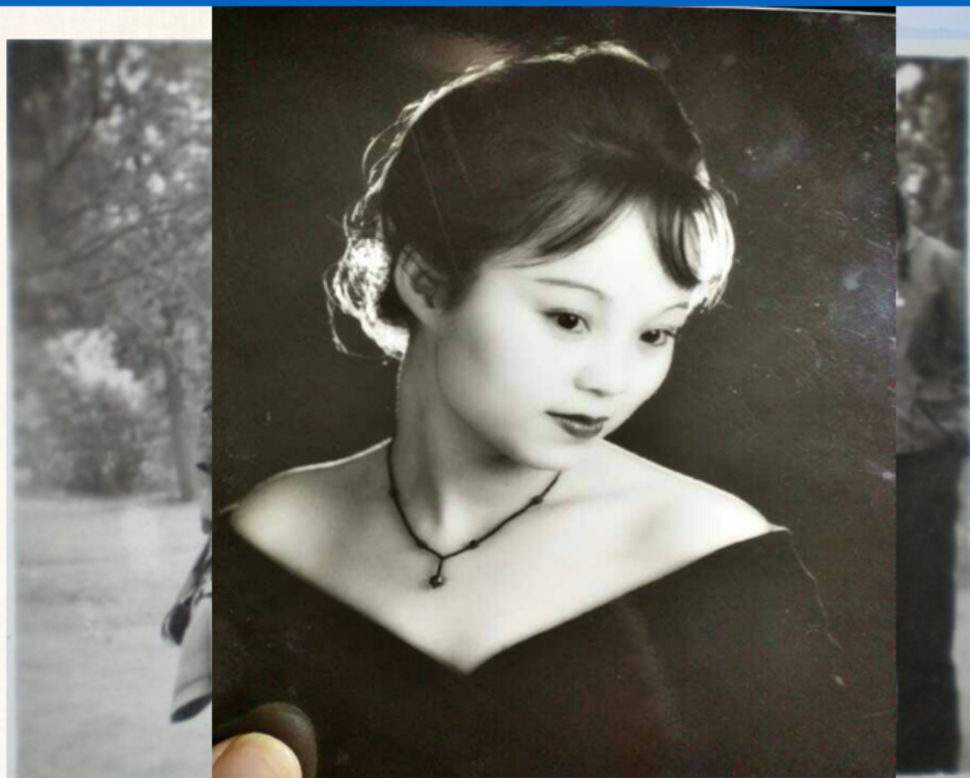
同一时期及2000年的着装风格